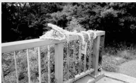
蟹田橋欄干の稲わらの大蛇

和町の国道128号に架かる花園橋の欄干に、稲わらで作った大蛇が大きな口を開けて西方を睨み、もう一つの蟹田橋の欄干にも、やはり稲わらの大蛇が東方を睨んでいます。これは昔から伝わる「道切り」という習俗で、二匹の稲わらの大蛇が、柴の集落に病魔や邪悪な鬼が侵入しようとするば、呑み込もうとしているのです。 この柴の習俗は江戸時代から続いているようですが、稲わらの大蛇は橋の近くに住む年輩の人たちが節分に作り、集落の境を流れる川の橋に掛けるのです。稲わらの大蛇は丁寧に作られており、大きく開く口の中には、先が割れた蛇の舌まで赤い唐辛子を使い作ってあります。 稲わらの大蛇とは言え、長く続けているので霊力があり、本当に病魔や角のある鬼を呑み込む、と土地の人たちは誰もが信じていますから、いつの頃からか、珍しい風習が生まれました。 文金高島田の花嫁が大蛇の前を通るときは、大蛇に鬼のような角がないことを見せるため、角隠しを外して通り、そして大蛇から離れると、外した角隠しを掛け直すのです。