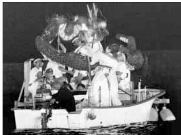
弁財天と龍神の舞

実行委員会と市では、県観光振興アドバイザー事業を利用し、イベント運営ボランティアや夜泳希望者募集、海女さんたちの入場から夜泳を経て花火に至るまで、舞も交えてストーリー性を持たせることなどを試みました。