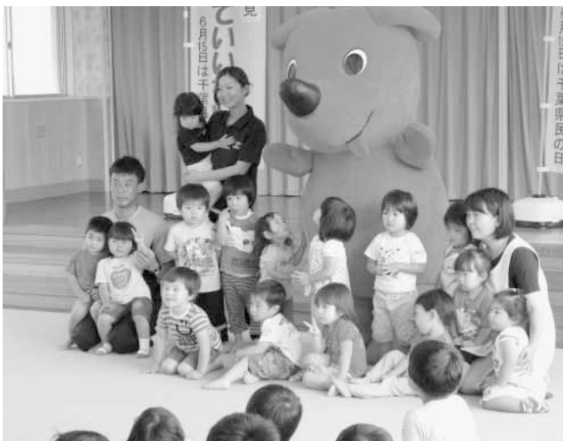
チーバくんと一緒に記念撮影