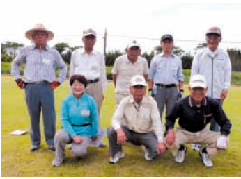
和地区グラウンドゴルフ連盟事務局の皆さん

大変楽しいスポーツです。多目的グラウンドに足を運び、私たちに一声かけてください。生き生きとすること請け合いです。一緒に気持ちよい汗を流しましょう。