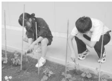
和田中学校の皆さん