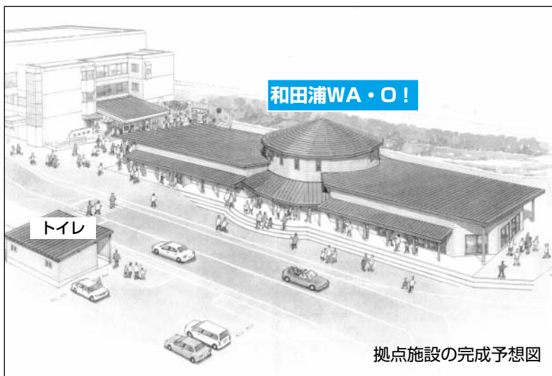
拠点施設の完成予想図

情報発信などの機能を備えており、施設を訪れる皆さんが、より快適に過ごせる環境を目指しています。 国土交通省に施設を「道の駅」として申請中で、8月には認定される見込みです。