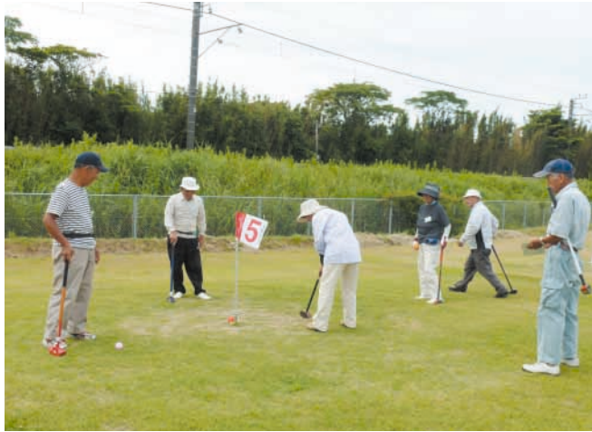
南房総市体育協会会長杯の様子

このコーナーは地域の市民活動団体を応援するコーナーです。地域でがんばっている団体をご存じでしたら情報をお寄せください。 市民協働課 ☎33-1005 みんなネットアドレス http://civil.mboso-etoko.jp/