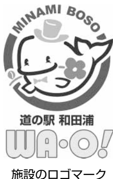
施設のロゴマーク

この施設が道の駅に認定されると、市内で8か所目の道の駅が誕生し、南房総市は岐阜県高山市と並び日本一、道の駅の多い市となります。