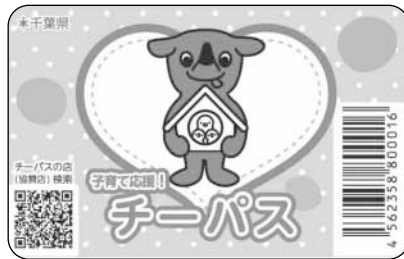
子育て家庭優待カード「チーパス」