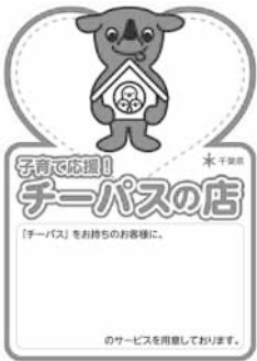
チーパスの店に貼られているステッカー