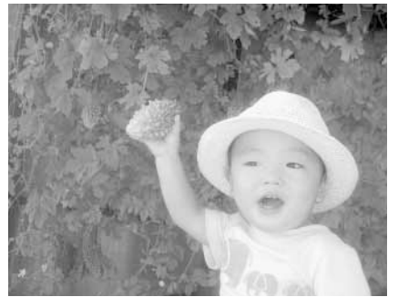
日よけになって実は食べられるよ

5月下旬に農業者年金基金から「現況届」が郵送されます。6月29日(金)までに農業委員会、朝夷行政センター、地域センターへ提出してください。「現況届」を提出しないと、年金の支給が一時停止されます。ご注意ください。