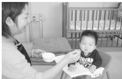
もぐもぐ教室で離乳食の進め方を学んでみませんか