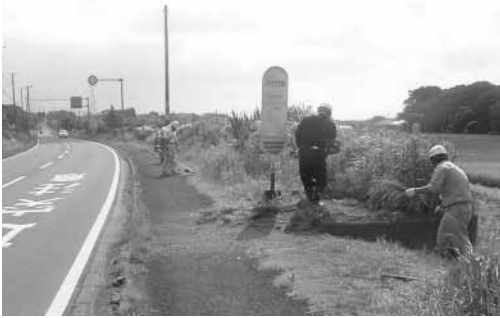
市防災協力会による草刈り作業

市防災協力会は、市内の建設業者を中心とし、公共の防災や地域社会に貢献することを目的に結成され、37社が会員になっています。