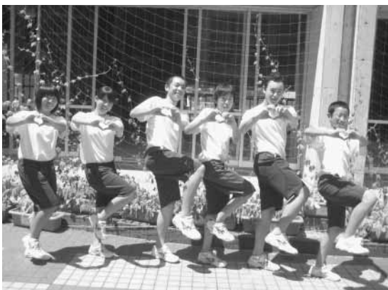
千倉中学校 生徒会の役員の皆さん