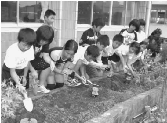
三芳小学校 4年生の皆さん みんなでゴーヤの苗を植えて、大切に育てています。