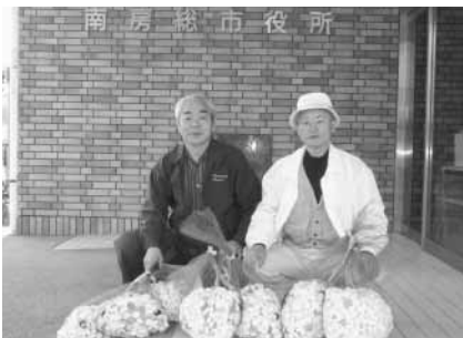
三芳地区：南房総エコネット 三芳地区の皆さん