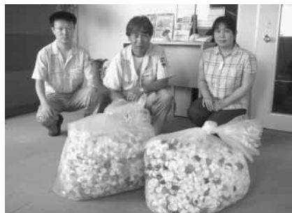
三芳地区：アメリカン電機 (株) の皆さん