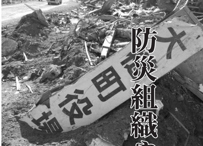
東日本大震災では役場も被災した