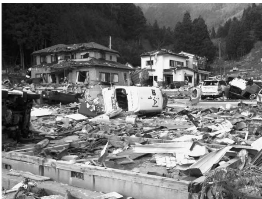
東日本大震災で津波被害を受けた救急車（石巻市役所雄勝総合支所）

過去の災害の教訓もしだいに現実味が薄れる。迫る危険も正常化の偏見により過小に受け止められる。今回の大震災の教訓をわれわれは子や孫たちに残せるだろうか。そもそも自身が覚えていられるのだろうか。