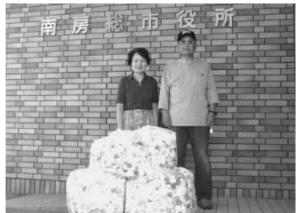
富山地区：市部ボランティアチーム の皆さん