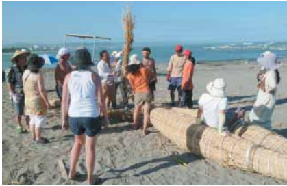
葦船作りにチャレンジ