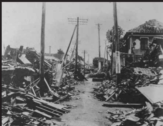
関東大震災で、那古では総戸数900軒のうち870軒が全壊。倒壊による圧死者は125人を越えた。『安房震災写真帖』（館山市立博物館）

安房西部の沖積地では、液状化現象が起き、地割れした場所から水や泥が噴き出した。南房総市でも、地割れ、土砂崩れ、地すべりなどの土砂災害が起きた。和田地区白渚では浅間山の南東斜面が崩落し、三原川がせき止められ、あふれた水で周辺の1万5000㎡以上の水田が流された。三芳地区では地震断層ができた。館山市相浜地区では、高さ9mの津波があり、およそ70戸が流失した。