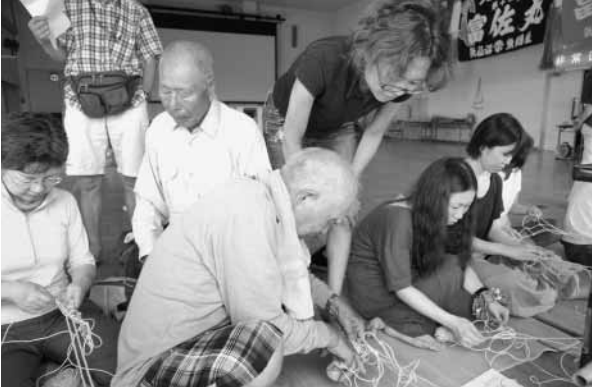
昔ながらの網作りを教える漁師

網の作り方体験に参加した女性は、「スイカを包む網や網バッグを作りたい」と、網の基本形とも言える本目（平結び）に挑戦していました。指導する漁師は「本目を網針 あはり を使わずに作る方法は今はやらないね。私も