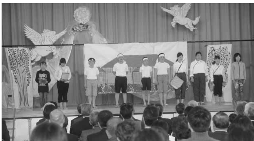
校庭にある2本のヒマラヤ杉を題材にした劇「ヒマラヤシーダは、見ていたよ」の発表

第2部では、明治41年に開校してからの八束小学校の歴史を、子どもたちが劇にして発表しました。明治期の開校から、大正、昭和、戦中、戦後の逸話や、現在の校舎ができてからの出来事などが子どもたちによって紹介されました。