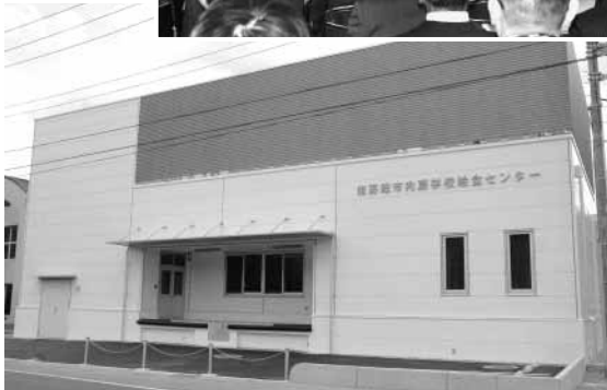
竣工した内房学校給食センター