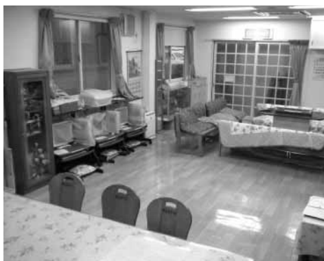
オープンスペースの談話室

障害者自立支援法による地域生活支援事業（市町村事業）のうち、障害者相談支援事業と、社会との交流の促進などを図ることを目的とした地域活動支援センター（I型）のサービスについて、南房総市・館山市・鴨川市・鋸南町から委託を受けています。