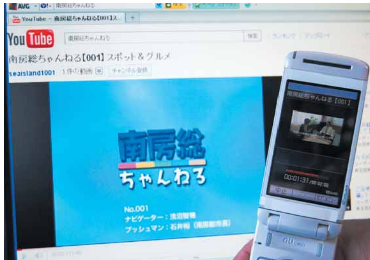
パソコンや携帯電話で情報発信

このコーナーは地域の市民活動団体を応援するコーナーです。地域でがんばっている団体をご存じでしたら情報をお寄せください。 問い合わせ 市民協働課 ☎ 33-1005