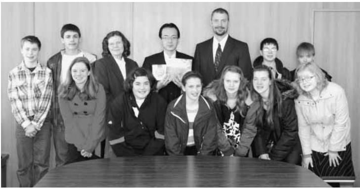
訪問したワシントン中学校の生徒と職員

生徒たちは日本に8日間滞在し、南房総フラワーマーチに参加するなど、富浦中学校生徒と友情を深めました。