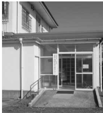
支援センター玄関