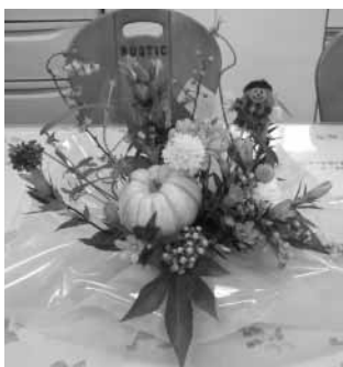
フラワーアレンジメント 教室の作品