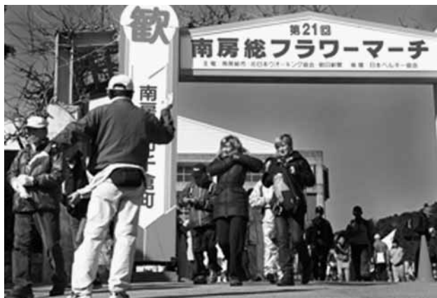
南房総フラワーマーチにベルギーから参加した女性

3月5日（土）、6日（日）の2日間にわたり、千倉中学校を中央会場に第21回南房総フラワーマーチが開催されました。