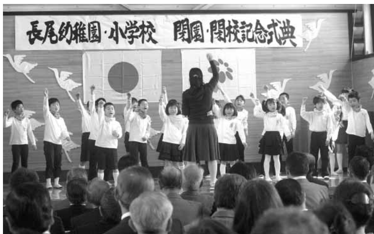
学校の思い出を合唱する長尾小学校の子どもたち