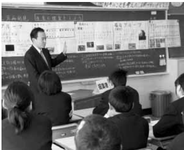
三芳中学校で開催された出前講座