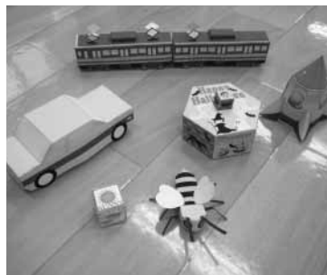
パソコン教室の作品 パソコンで型紙を作り製作