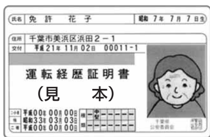
運転経歴証明書