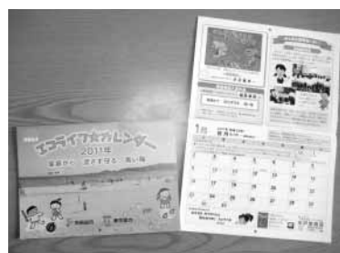
「エコライフカレンダー 2011年版」のイメージ

環境保全課、支所、とみうら元気倶楽部、富山公民館、三芳農村環境改善センター、白浜公民館、千倉公民館、丸山公民館、丸山子育て支援センター、和田地域福祉センター「やすらぎ」