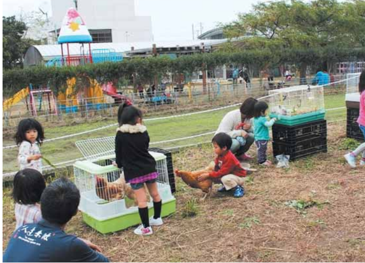
「小動物と遊ぶ」をテーマに、子どもたちは動物との「ふれあい」を楽しみました

このコーナーは地域の市民活動団体を応援するコーナーです。地域でがんばっている団体をご存じでしたら情報をお寄せください。 市民協働課 ☎ 33-10005