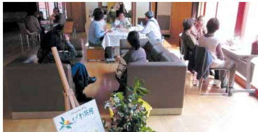
「びわ茶房」おいしいコーヒーとお菓子、会話を楽しんでみませんか

「びわ茶房」は、地域の憩いの場として毎週水曜日の午後1時30分から午後3時30分までとみうら元気倶楽部でオープン。おいしいコーヒーとお菓子を100円で提供しています。お茶やお菓子を楽しみながらくつろいだり、気軽にしゃべりしてみませんか。12月21日(水)にはミニクリスマスコンサートとして、ハーモニカの演奏も行います。ぜひお立ち寄りください。 『さざなみ』では一緒に活動してくれる仲間を募集しています。世代を超えた活気あるまちづくりを目指しませんか。 ☎ 20-4744 『さざなみ』事務局(とみうら元気倶楽部内)