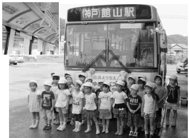
白浜幼稚園の園児が「ゆめのバス」の絵を書き JRバス関東のバス車内を飾りました

（富山地区）のように廃止路線を市が直接運行する「市営路線バス」のほか、丸線（館山駅～三芳病院前～川谷・細田）や、平群線（館山駅～三芳病院前～平群車庫）のように南房総市や館山市がバス事業者に委託して廃止路線を維持する「廃止代替バス」により、市民の移動の足を確保しています。 市が維持する路線が多くなると、事業者への補助金が増え続けます。最悪の場合、路線の存続ができなくなることも考えられます。