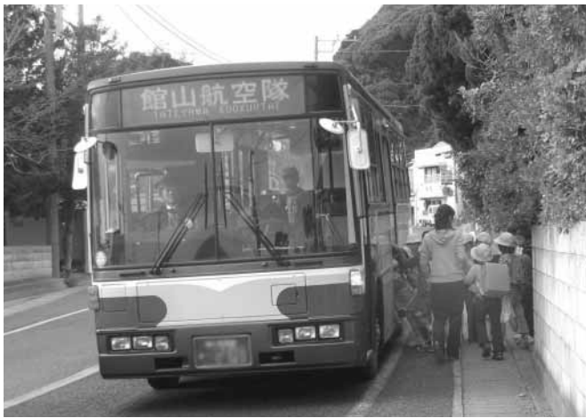
富浦小児童の下校 民間路線バスは欠かせない足となっています