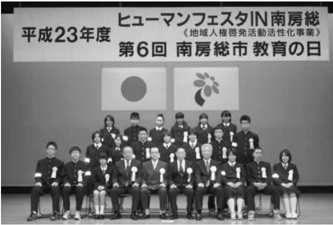
表彰された皆さんと関係者

今年の中行事は、地域人権啓発活動活性化事業「ヒューマンフェスタIN南房総」と同時開催されました。表彰された皆さんは次のとおりです。(敬称略)