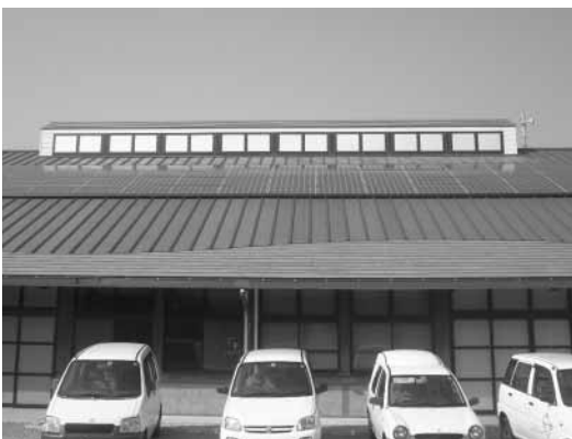
三芳分庁舎に設置された太陽光発電設備