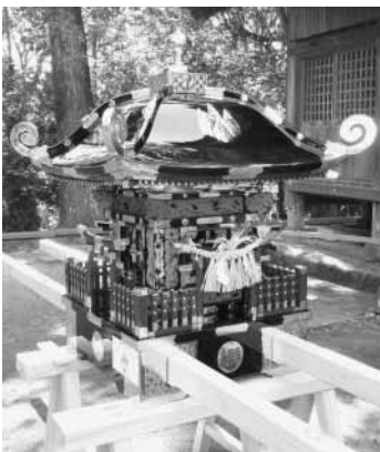
補修された子ども神輿

杵見区(丸山地区)の子ども神輿が、宝くじの収益金を活用したコミュニティ助成事業で補修されました。郷土愛が育まれ、地域全体の活動が活発になることが期待されます。コミュニティ助成事業は、(財)自治総合センターが、地域振興や地域コミュニティ支援を目的に、宝くじの普及広報事業として行っています。