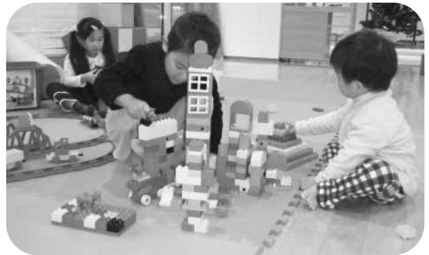
楽しいおもちゃがたくさんあります