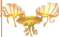
(イメージ) 椅子または机などを一つ作ります