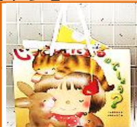
ブックカバーのエコバックイメージ