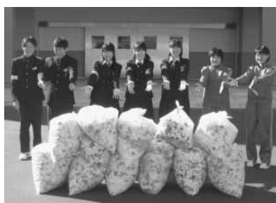
白浜中学校生徒会の皆さん