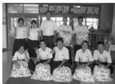
和田中学校生徒会の皆さん