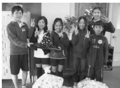
三芳小学校児童会の皆さん