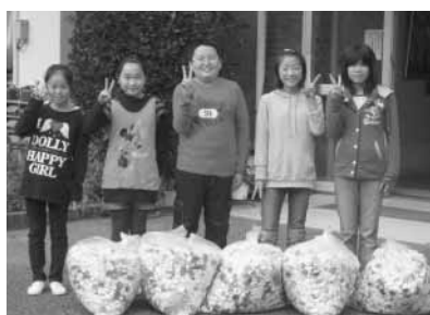
和田小学校児童会の皆さん