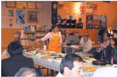
地域の昔料理の試食会

和田地域づくり協議会『WAO!』は、「わいわいと温かみのある おらが町」を目標に、より良い和田の地域づくりをするため、昨年4月22日に発足しました。3部会プロジェクトで活動しています。1月に行った活動として、和田小学校の児童と一緒に通学路の危険か所の点検をしました。当日は、『WAO!』会員のほかに和田小学校の児童、先生、PTA、地域のボランティアの皆さんにも協力していただき、子どもたちの下校時刻に合わせて調査しました。「こ危なくないかな?」「危なくないよ」など、子どもたちとコミュニケーションを図りながら通学路を歩きました。調査したあとは、会員と子どもたちと一緒に大きな地図に落としこむ作業を進め、「和田っこあんぜんマップ」という形でもつじき完成します。ほかに、地域の活性化につなげられないかと、和田地域に昔からある料理の試食会やサークル・ボランティアの皆さんの活動を紹介する寺子屋講座の開催、海岸の美化活動への参加をしています。 『WAO!』ではNPO法人化を目指し、整備を計画している和田地域拠点施設の管理などの協議を進めています。 「和田を元気にしたい」「和田のために汗を流したい」と思っている人、私たちと一緒に活動してみませんか。 問い合わせ 『WAO!』事務局 ☎47-509050