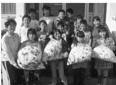
南三原小学校環境委員会の皆さん