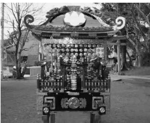
補修された寺庭区神輿

コミュニティ助成事業は、財団法人自治総合センターが、地域振興や地域コミュニティ支援を目的に、宝くじの普及広報事業として行っています。