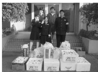
富山中学校生徒会の皆さん