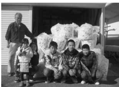
上瀬戸ほしぞら子ども会の皆さん