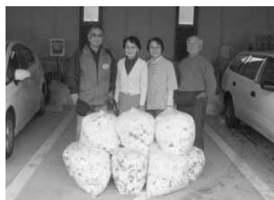
市部ボランティアチームの皆さん