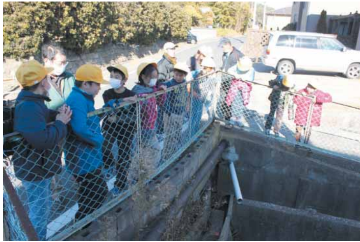
小学生と一緒に安全マップづくり

このコーナーは地域の市民活動団体を応援するコーナーです。地域でがんばっている団体をご存じでしたら情報をお寄せください。 問い合わせ 市民協働課 ☎33-10005