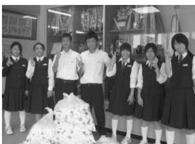
三芳中学校生徒会の皆さん