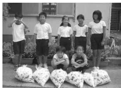
長尾小学校美化栽培委員会の皆さん