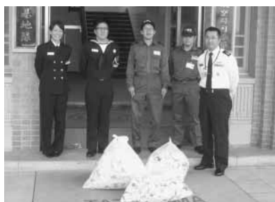
館山海上自衛隊の皆さん