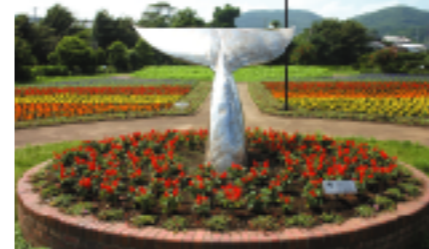
花の広場公園「花夢花夢」