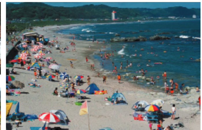
環境省による快水浴場百選 和田浦海水浴場