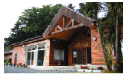
自然の宿「くすの木」