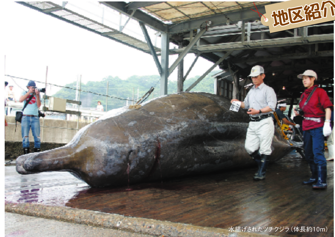
水揚げされたツチクジラ (体長約10m)