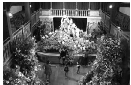
花空間を楽しむ観光客

カトリア、ストック、カーネーション、ユリなど色とりどりの花のオブジェが観光客に人気のイベント「花空間」、シェイクスピア・カントリー・パーク(丸山)で開催されました。地元の農業研究会が中心となり、舞台に古木を配し、赤い花を中心に飾られました。立体的で、華やいだ花空間を出現させ、甘い香りに包まれたホールを訪れた観光客は、「日常のストレスから解放されるようだ」と述べていました。