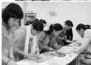
房州うちわ作りに取り組む香港の中学生