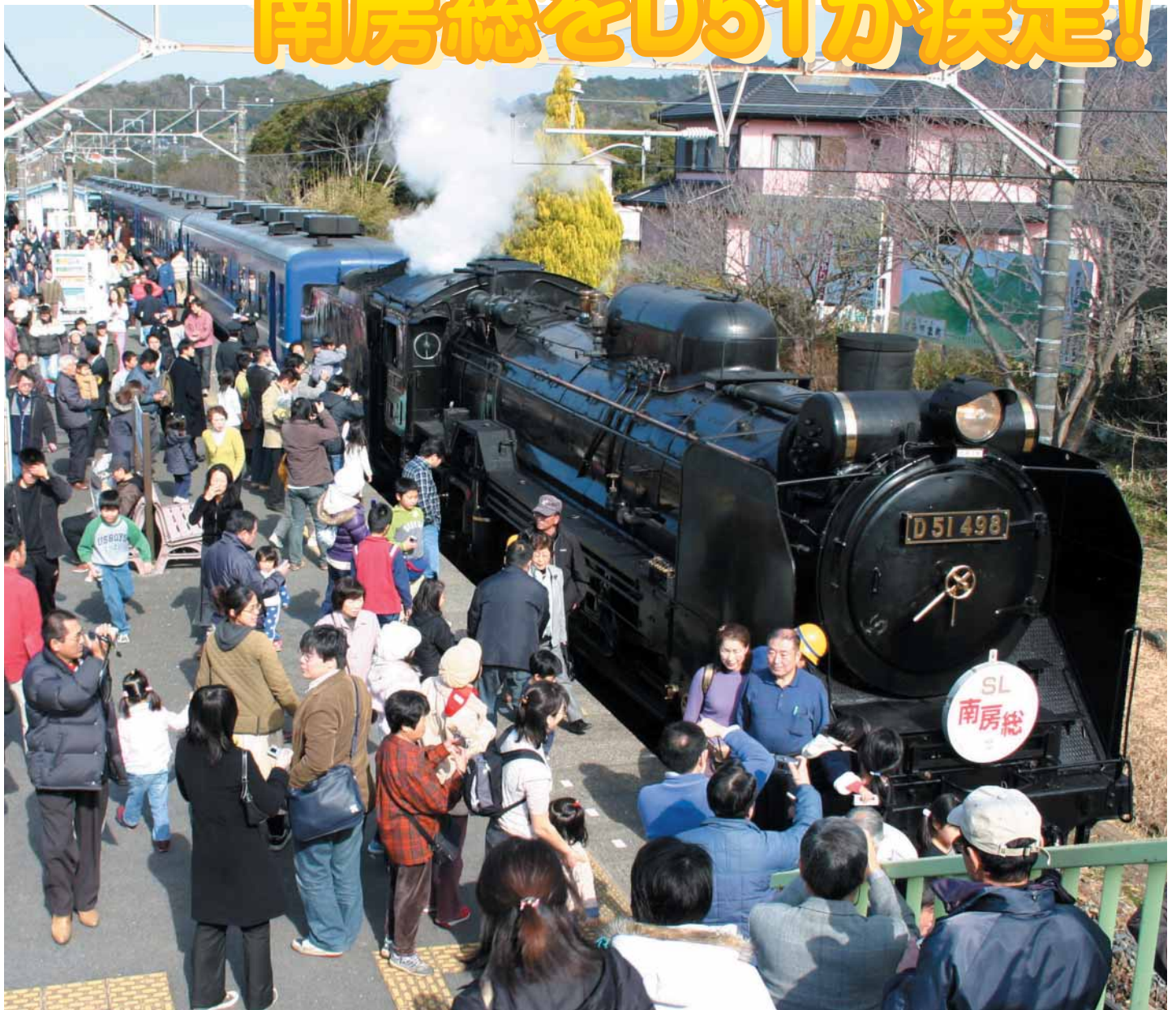
懐かしの蒸気機関車D51-498が南房総にやってきました (JR岩井駅)