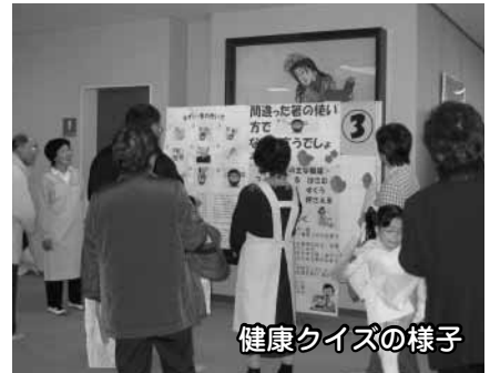
健康クイズの様子

会場内には、保健推進員が毎日の朝食づくりに役立ててもらおうと工夫を凝らした朝食が展示されました。