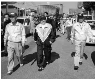
知事がウォーキングに参加