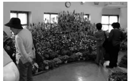
春を演出ファーマーズフェスタ

潮風王国(千倉)を会場に、ファーマーズフェスタが開催されました。農業者で構成される南総シードの皆さんが、地元の花を会場いっぱい飾りつけ、一足早い春の空間を演出しました。訪れた観光客は、色とりどりの花を楽しんで、南房総の春を感じていました。期間中には、農産物の直売や乳しぼり、バター作りなどのイベントも行なわれました。