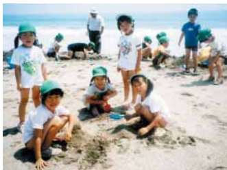
南千倉海岸で砂あそび

かせや家庭への貸し出しも定着してきました。園外保育は自然物さがしだけでなく、地域の人たちとの触れ合いも大切にしています。高家神社に行った時には、梅林の梅もぎを見せてもらい、いろいろな話をするうちに、去年作った梅干を食わせてもらうこ