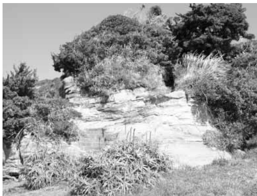
南房総の元禄地震隆起段丘

指定された段丘は、広さ約919㎡で地層が確認できる岩が隆起し、一部木に覆われており、三嶋神社が所有しています。