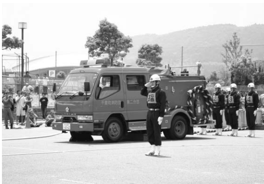
演技を披露する第5支団第2分団