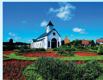
道の駅「ローズマリー公園」