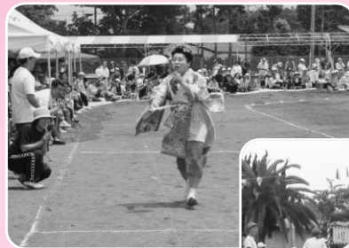
健田幼小運動会の様子 (千倉地区)