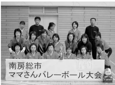
3位 白浜ウィングス