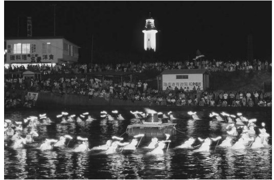
海女大夜泳の様子