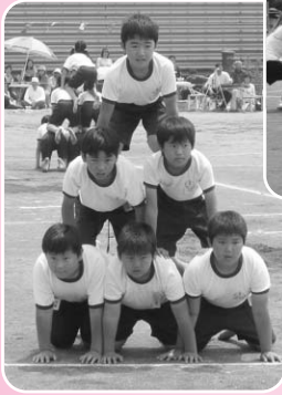
南幼小大運動会の様子 (丸山地区)