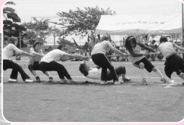
長尾幼小合同運動会の様子 (白浜地区)

児童だけでなく、保護者や先生も白熱した戦いを繰り広げ、非常に有意義な一日を過ごしました。