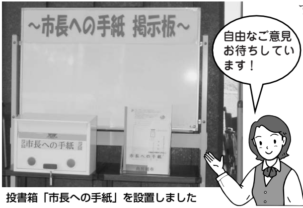
投書箱「市長への手紙」を設置しました