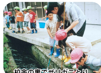
校舎の裏でザリガニとり