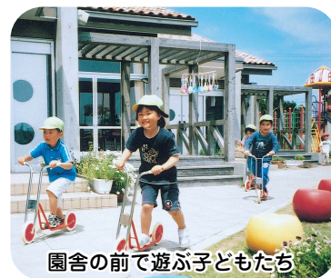
園舎の前で遊ぶ子どもたち

同年齢の子どもたちとも切磋琢磨できるよう、旧町内の幼稚園の子どもたちと、積極的に交流しています。