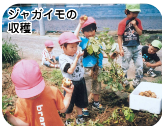
ジャガイモの収穫

園舎は小学校の校舎と一体となっていますので、園児たちは毎日、小学校のお兄さん、お姉さんの遊びや活動を間近に見て、小学校を肌で感じています。さらに、小学生の縦割グループに加わり、磯遊び、集会活動、運動会のリズムなど一緒に行っています。