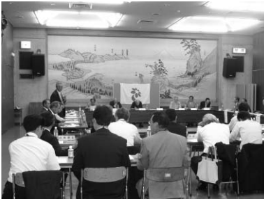
行政連絡協議会の様子