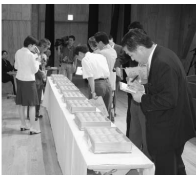
珠玉の逸品を審査する様子

岩井枇杷組合・館山枇杷組合 千葉県農林水産部長贈呈 八束枇杷組合 安房農林振興センター所長贈呈 原岡枇杷組合