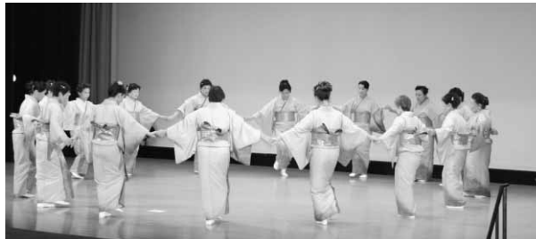
南房総さわやか音頭