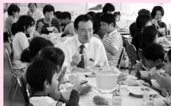
市長が子どもたちといっしょに給食