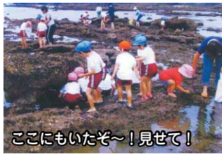
ここにもいたぞ～！見せて！