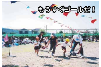
もうすぐゴールだ！