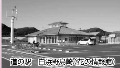
道の駅 白浜野島崎(花の情報館)

房総半島を一路、南に向かうとその終着点、道の駅「白浜野島崎」です。冬に咲く花の潤い、夏のさわやかな海の蒼さが、大きな魅力です。人は皆、岬の最南端に行ってみたくなる。太平洋の水平線が丸く見え、カモメたちが歓迎の声をかけてくれる。春に一番近いまちのお花畑、花々は笑顔で迎えてくれる。