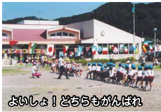
よいしょ！どちらもがんばれ