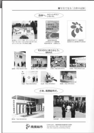
合併記念式典冊子

南房総市は、平成の大合併では県内最多となる富浦町、富山町、三芳村、白浜町、千倉町、丸山町、和田町の旧7町村により3月20日に誕生しました。 新市の面積は、230・22km 2 で県内56市町村中5番目、人口は、4万4千763人（平成17年10月1日現在 国勢調査）で33番目です。