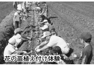
花の苗植え付け体験

この苗が花になる3月ごろに摘み取り体験を行い、摘み取った花は6年生のお兄さんやお姉さんの卒業式にプレゼントをするのになつていきます。