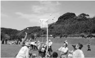
安房地区障害者スポーツ大会の様子

スポーツを通じて体力の維持や健康の増進、また社会参加を促進し親睦を図ることを目的に、安房地区身体障害者福祉会が主催する第33回安房地区障害者スポーツ大会が、10月14日(土)館山市にある千葉県立館山運動公園を会場に行われました。