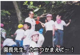
園長先生、カミつかまえて～！

富浦の豊かな自然に恵まれた環境を生かし、四季をとおして自然のなかで遊べるよう園周辺への散歩や海遊び・磯遊び・大房岬での園外活動も行っています。心も体も開放される自然のなかで体験をとおして季節の移ろいのなかで動植物・気象の変化に気づく感性を磨き、さらに友だちと一緒に遊ぶ楽しさを味わいながら、やさしさ、たくましさなども育ててほしいと願っています。