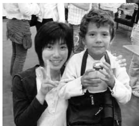
ホームステイの様子