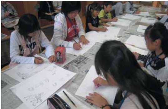
子どもたちも紙芝居づくりに挑戦

今年度、実施している、緑の探検（樹木ラリー）と紙芝居を活用した大房岬ガイド養成ステップアップ事業では、ふるさとの自然や歴史、文化などの地域資源の掘り起こしと活用のため、大房岬の樹木や植物を活用した体験メニューづくりとミニマップの作成、大房岬の歴史や富浦の民話を中心とした紙芝居の作成を行っています。今後は、それらを活用し、ガイドのさらなるステップアップを図っていきたいと考えています。