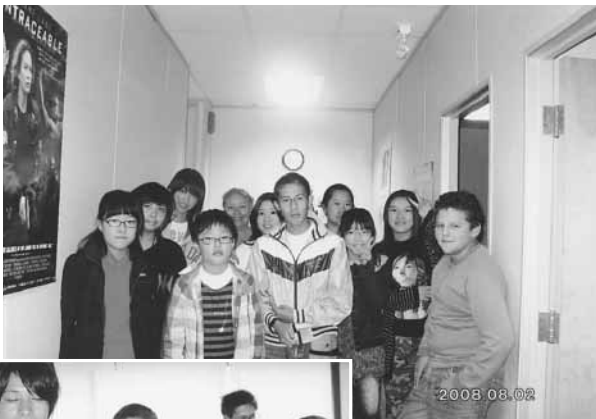
ホームステイの様子

カナダで過ごした期間はあっという間に終わってしまったけど、たくさんさんのことを学ぶことができました。今回のホームステイで学んだことをこれからの人生での糧にしたいと思います。そしてまた機会があればいろいろな国に行っているいろいろなことを学びたいと思います。この研修は一生の思い出です。本当にありがとうございました。