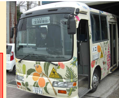
※市営路線バス 「富浦線・さざなみ号」